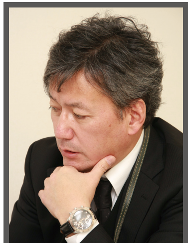
北海道テレビ放送株式会社 営業局 企画事業部 副部長