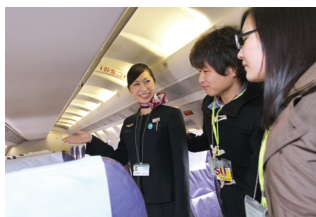
▲機内も案内していただきました。

チアリーディング部に所属して、野球やアメフトの応援、大会出場のための練習をしていました。大学生活は部活にバイト、遊びって感じてたね(笑)。何でもいいので「これだけは頑張った」というものがひとつあれば、就活の時に自信を持って望めると思っています。私は大学に通いながら、1年間CAの専門学校にも通いました。