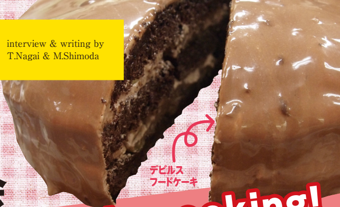
デビルス フードケーキ